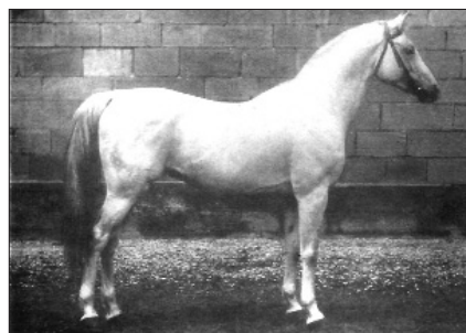
Amurath Weil (AV), 1881, Weil, von Tajar IV, 1873, Weil, aus der Koheil III, 1876, Weil.

Bairactar stammte aus der Familie Saqlawi-Jidran. Siglavy ist der gleiche arabische Wortstamm wie Saqlawi, der nach Flade bedeutet: «Gut gebaute, tiefe Flanke. In der Kennzeichnung der in drei Biotypen gegliederten Hauptstämme der arabischen Vollblutzucht, den Kuhaylans, Saqlawis und Muniqueis werden die Saqlawis im allgemeinen als im Ausdruck stark feminin, sehr elegant und in den begrenzten Körperlinien feiner und runder als die Kuhaylans bezeichnet. Die Saqlawis gelten als besonders leichtfuttermäßig und sehr anpassungsfähig im Temperament. In Kopfform, Tiefe und Breite des gesamten Körperbaus sind sie vom Kuhaylantyp kaum zu unterscheiden». (Flade)