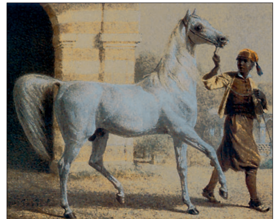
Bairactar, db, geboren 1813, Arabien.

El Nabila B, 1996, Bábolna, H - AV out of: 218 Elf Layla Walayla B, 1991, Bábolna, S - AV