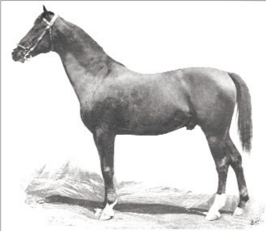
Dahoman XII, 1888, Horodenka, von 8 Dahoman VI-8, 1878, Radautz, aus der 20 Norma, 1863, Horodenka.